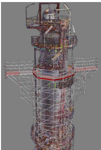
Bild 2: Durch die 3D Gerüstplanung konnte die nicht-alltägliche Gerüstkonstruktion in 65 Meter Höhe präzise geplant werden.