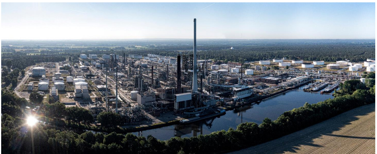
Bild 1: Panorama-Luftaufnahme der bp Raffinerie in Lingen

spezialisierte Unternehmen beschäftigt an seinem Hauptsitz in Oberhausen und seinen sieben weiteren Niederlassungen in Deutschland über 1.500 Mitarbeiter.